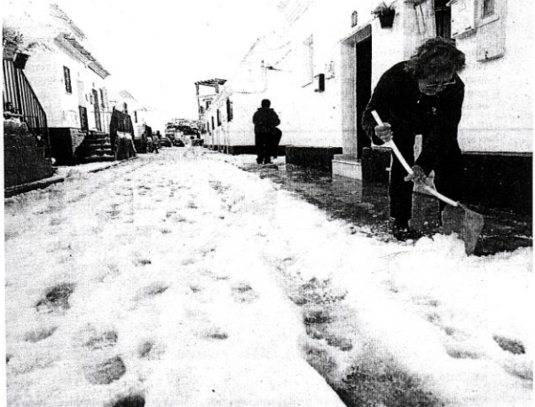
DISFRUTE. Los niños llenaron Canillas de muñecos.